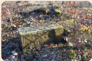
Az elpusztult kőkereszt újjászületése