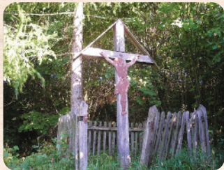
A fakereszt ismét régi fényében