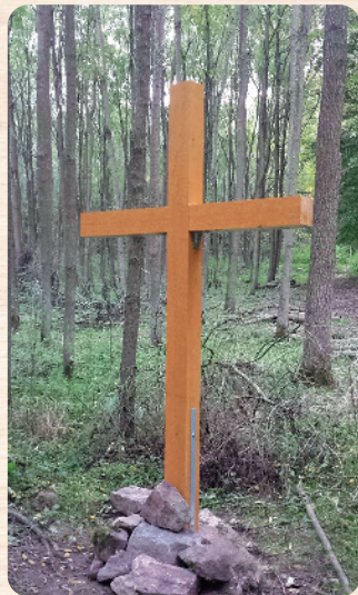
Erszék falu templomának egykori helyén ma fakereszt áll