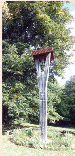
A villás tölgyfából faragott, 5,5 méter magas fa harangláb egykor és ma