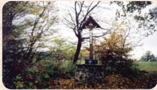
A kereszt egykori, romos állapotában, és felújítva