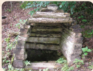
A jó minőségű, iható vizű kút felújítást megelőző és mai állapotában