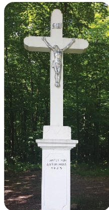
Erdői pihenőhely mellett áll a felújított Hesz-kereszt