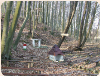
Az erdei környezetben fekvő Szent István forrás régen és ma