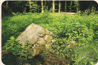
Áldatlan állapotok – 2013