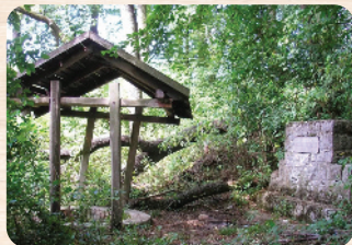
Az 1943-ban foglalt forrás megszépült küldővel várja a kirándulókat