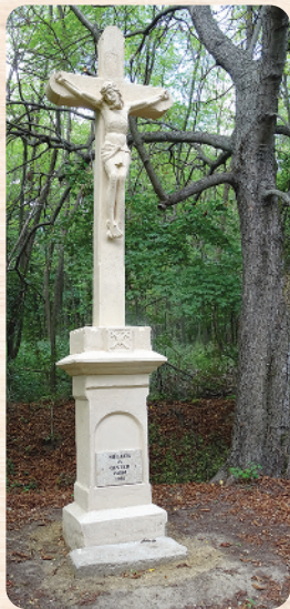
A Maksz-kereszt környékét egykor szőlőskertek tarkították

A Maksz-kereszt jelentős útkeresztződésben áll, amelyet jól mutat egy 1865. évi kataszteri térkép kivágat.