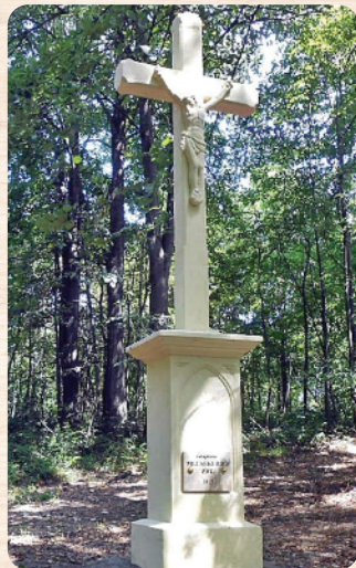
A megújult kőkereszt egykor szőlőskertek, gyümölcsösök útelágazásában állt