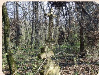
A csebényi temető egykor és ma