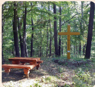
A megújult erdei kereszt