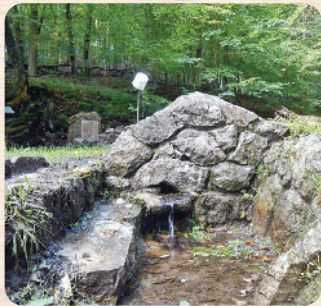
A szépen kiépített forrás vize iható

Az emlékkő felirata a forrás támfalán ma is olvasható: „Vándor, hogyha szomjúság gyötör, e rengeteg erdőben állj meg itt az Isten-kútnál, vedd az ivókád a kezedbe, éltesd szegény Magyar hazát. A bor hevít, a víz életet, de a bornak ára vagyon, a vizet a természet Istene ingyen adja, 1862”