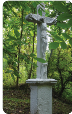
A csebényi kőkereszt korábbi és felújított állapotában