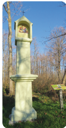
A régi és a megújult képoszlop