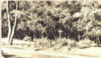
A keresztkunyhó 1901-ben és ma