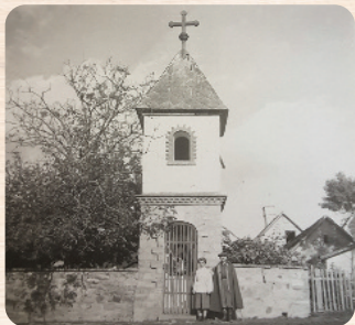
Az utóbbi években szép kis kápolnafülke jelleget öltött