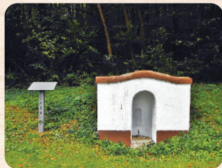
A felújított forránház