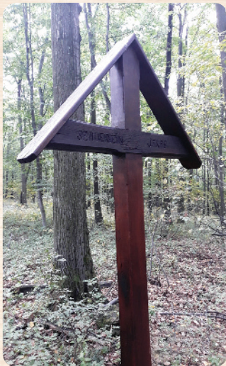
A megújult keresztet egykor Szauervein Jakab emlékére állították