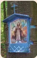
A forrás mögötti bükkfán található Mária-kép és a forrás környezete egyaránt megszépült