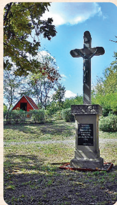
A székelyszabari kőkereszt egykor és ma