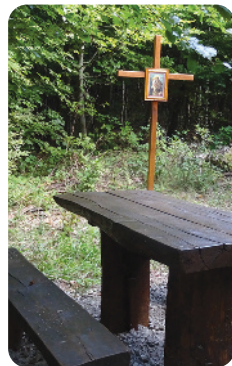
A hatalmas bükkfa melletti fakeresztre új Szent Antal kép került