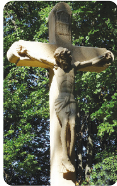
A kisújbányai temető kökeresztje egykor és ma